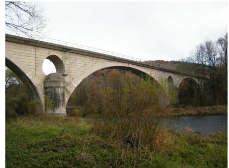
Eisenbahnbrücke, Garching a.d. Alz