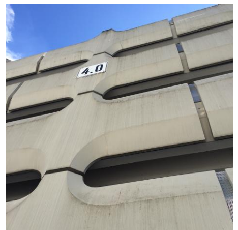
Parkhaus der BMW, München

14:15 Bewährt? – Anwendung, Wirksamkeit und Dauerhaftigkeit von Hydrophobierung auf Beton Dipl.-Rest. Sarah Hutt M. Eng., Büro für Bauwerkserhaltung, Denkmalpflege und Restaurierung, Köln